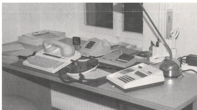
Einer der beiden Arbeitsplätze des Vermittlungsdienstes am Standort in Wald.

Der Vermittlungsdienst ist täglich von 7 bis 22 Uhr erreichbar. In Spitzenzeiten (nur werktags) von 17 bis 21 Uhr müssen die Anrufer dank der neuen Doppelbesetzung nicht mehr ungeduldig warten. Ab 1. März wird zusätzlich von 9 bis 12 Uhr eine weitere Doppelbesetzung eingerichtet.