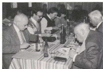
Beim gemeinsamen Imbiss.