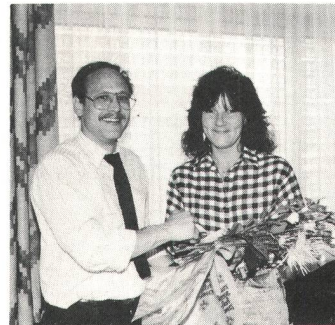
Blumen für das 150. Mitglied.

Und jetzt folgte die angekündigte Überraschung: Ein «echter» Polizist von der Kantonspolizei Aargau war gekommen – extra um den Versammelten – an die hundert Personen waren im Saal – einen Vortrag zu halten über Alkohol am Steuer. Ein Blick