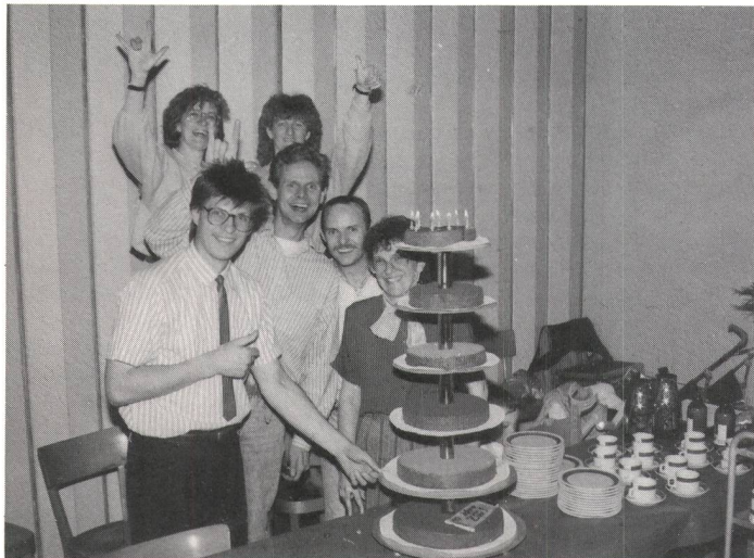
Der ZGV-Vorstand hat wirklichen Grund zum Ausflippen . . .

(wag) Erster Akt: Im Anschluss an seine 10. Generalversammlung offeriert der Zürcher Gehörlosenverein den Teilnehmern einen Imbiss inklusive Dessert und Kaffee zu einem Spottpreis von nur einem Fünfliber. Der zweite Akt folgt am 23. September, wenn der ZGV den «Tag der Gehörlosen» und dazu auch die Abendunterhaltung organisieren wird. Und die Fakten der Generalversammlung 1989: Eine rein statutarische Angelegenheit.