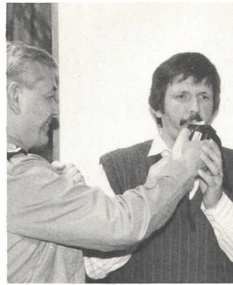
«Tüchtig blasen in das berüchtigte Röhrchen.»