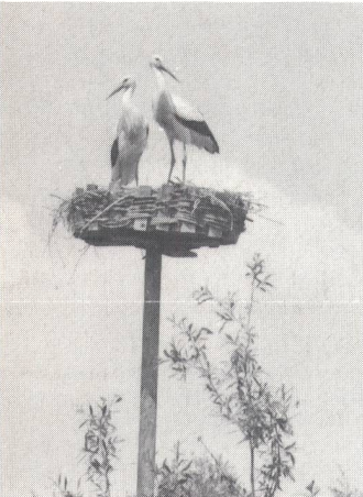
Punkto Nachwuchs: Glauben auch Sie immer noch an den Storch?

(mh) Viele Vereine kämpfen mit Nachwuchsproblemen. Was sind die Gründe? Die Mitarbeit im Verein ist mit Arbeit und Pflichten verbunden. Liegt es wohl daran, dass jüngere Menschen nicht mehr bereit sind, in ihrer Freizeit noch zusätzliche Verantwortung zu übernehmen? Oder handelt es sich einfach um eine Zeiterscheinung? Wir versuchen in diesem Bericht dem Problem etwas auf den «Zahn» zu fühlen.