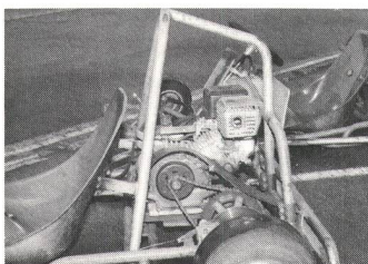
Kart-Motoren: klein aber leistungsfähig.

Erfinder des Go-Karts ist der Amerikaner Art Ingels. Art war Rennwagenmechaniker und baute im Herbst 1956 den ersten Kart. Für heutige Begriffe recht primitiv wurde das Fahrzeug durch einen 2½ PS West Behnd Rasenmähermotor angetrieben. Kaum hatte Art sein Fahrzeug propagiert, kamen zwei andere Männer auf die Idee, eine Anzahl dieser Fahrzeuge zu bauen und sie zu verkaufen. Als man einen Namen für die Firma suchte, kam man auf die Idee «Go-Kart MFG CO». Somit hatte die Geburtsstunde einer Bezeichnung geschlagen, die heute Begriff ist.