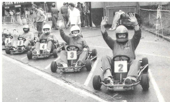
Fahrt frei für die unentwegten Kartfans.

27 Mitglieder der SVGM hatten sich zum 3. Lauf der Clubmeisterschaft eingeschrieben. Jeder wollte der Schnellste sein, doch gewinnen kann in einem Wettkampf bekanntlich immer nur einer. Aus Sicherheitsgründen sind Massenstarts der nichtlizenzierten Go-Kart-Fahrer nicht gestattet. Daher wurden die Teilnehmer in fünf Gruppen eingeteilt und in 3-Sekunden-Abständen ins Rennen geschickt. Ein Einzelzeitfahren gegen die Uhr also.