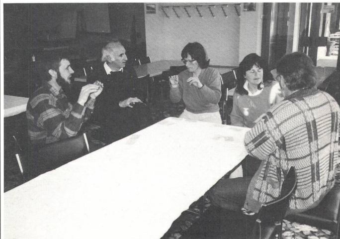
Eifrig werden Gebärdensprache geübt.

von Techniken der Gebärdensprache). Ohne Stimme miteinander zu kommunizieren war die wichtigste Kursregel. So konnten wir die Welt der Gehörlosen ein wenig spüren. Es war immer wieder sehr schwierig, ohne Stimme das zu sagen, was wir wollten. Oft war es fast unmöglich, nur mit dem Körper zu sprechen. Trotzdem haben wir mit grosser Freude gearbeitet und gelernt. Wir danken unseren gehörlosen Lehrern für ihre Phantasie und Geduld. Der Wunsch der Lehrerschaft ist gross, die Verständigung in der Schule zu verbessern – ohne die Bedeutung der Lautsprache für die Berufsbildung der Gehörlosen zu verkennen. Das war auch das Thema des letzten Lehrerkonvents. Wir möchten an den Problemen weiterarbeiten, über welche auch in den Leserbriefen der SGB-Nachrichten geschrieben wurde.