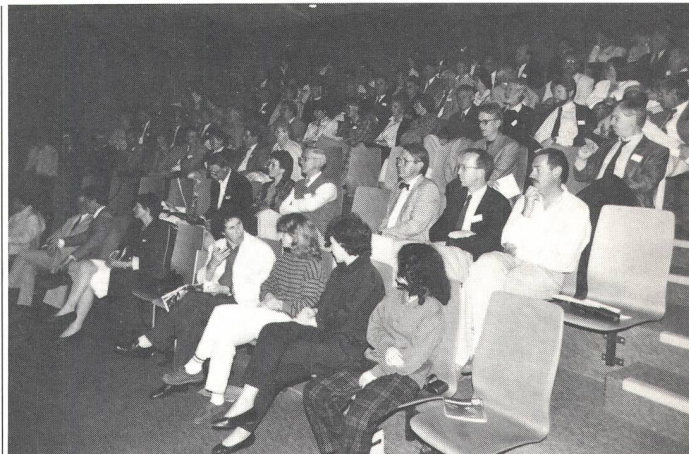
Aufmerksame Zuhörer an der Schuldirektoren-Konferenz.

Die Teilnehmer liessen sich im Gehörlosen-Zentrum über die Bildungssituation in der Schweiz informieren. Dazu waren sie am Abend Gäste in der Gehörlosenschule. Einen Nachmittag verbrachten wir auf einer Rundfahrt um den Vierwaldstättersee und auf Hohenrain. Daneben wurde auch hart gearbeitet und diskutiert. Wir haben viele gemeinsame Probleme. Es ist deshalb sehr interessant zu hören, wie die andern Länder die Schulungsaufgaben lösen. Wir haben in der Schweiz auch zu lernen von den andern; wir können aber auch heute über gute schweizerische Lösungen berichten. Es war einmal mehr eine frucht-