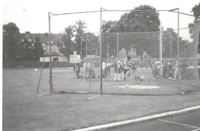
Diskuswurf: Toni Schwyter 6. Rang, 2 x Schweizer Rekord.

zer Rekord über 30 m gebrochen hatte. Er freute sich, dass er einen guten sechsten