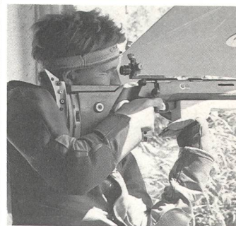
... und dann: Bumm!