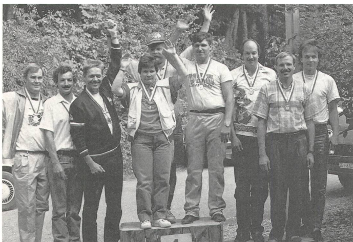
Frohlocken nach getaner «Arbeit».

Schon zum 10. Mal organisierte die Abteilung Schiessen des SGSV die 50-m-Schweizermeisterschaft im Kleinkaliber-Gewehr. Dies kann man ein kleines Jubiläum nennen.