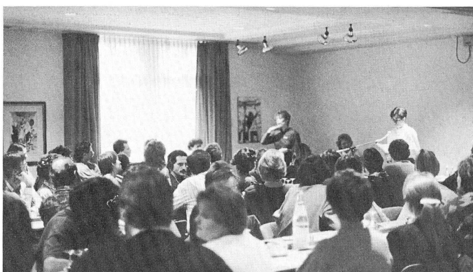
... und die gehörlose Reisegruppe «hört» gebannt zu.

Wie früh muss man buchen; gibt es übrigens auch eine Wintersaison?