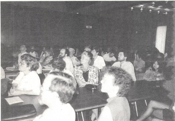
Gespannt verfolgen die Delegierten den Verlauf der Verhandlungen.

Die 58. Delegiertenversammlung des Schweizerischen Verbandes für das Gehörlosenwesen (SVG) hatte mit den Schiffen des Vierwaldstättersees eines gemeinsam: sie war reich befrachtet! Ein guter Geist aber herrschte vor. Miteinander, nicht gegeneinander. Und daher ist man in Weggis in der Verbandsarbeit auch ein wackeres Stück weitergekommen.