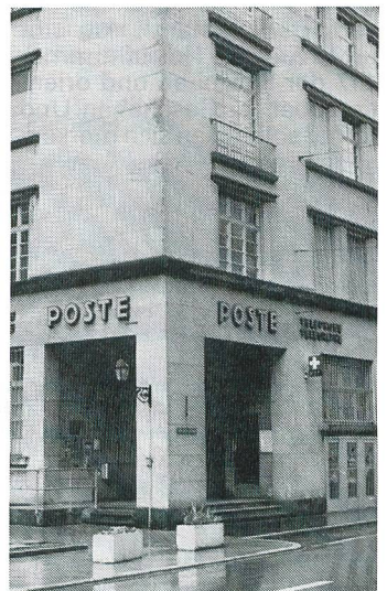
Postbüros erhalten immer wieder unerwünschten Besuch.

Und Kassiererinnen und Kassierern wird zusätzlich geraten, zuerst kleine Noten auszuhändigen, wenn Geld verlangt wird. Die Notenbündel sind aufzureissen, damit es nach