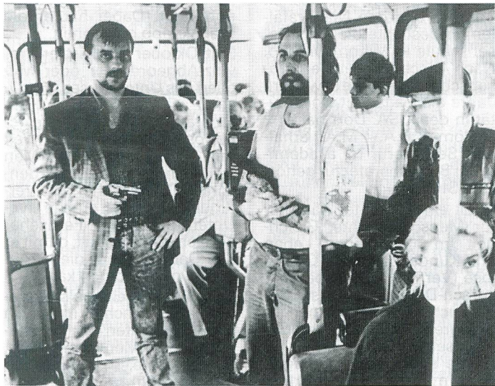
Die Bankräuber und Geiselnnehmer von Gladbeck.

Vor kurzem waren wir Zeugen folgender Szene: Zwei junge Männer mit dicken Reisetaschen verliessen eiligen Schrittes ein grosses Olteners Warenhaus. Sie fielen weiter nicht auf. Auffallend wurde die Sache erst einige Augenblicke später. Den beiden stürzte nämlich ein Duo Verkäuferinnen nach, durch ihre Arbeitsschürzen an einem Spurt gehindert: «Sie hend zwei Jacke klaut», keuchte die eine und gab die Verfolgung nach wenigen Metern auf. Weit und breit keine Gauner mehr. Der Erdboden schien sie verschluckt zu haben. Das Ganze entpuppte sich als ein gewöhnlicher Ladendiebstahl. Es hätte aber ebensogut ein Überfall oder Raub sein können. Wie soll man da als Zeuge oder Opfer reagieren?