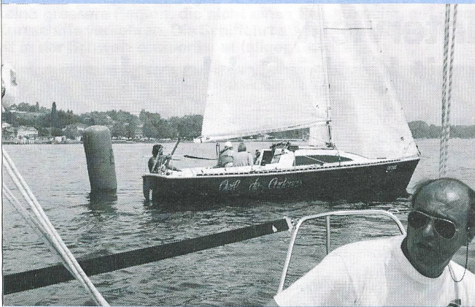
Die Handicap-Trophy wird auf Schiffen vom Typ «Surprise» gesegelt.

Segel-Weltmeisterschaften der Behinderten 29. Juni bis 7. Juli 1991, Nyon VD