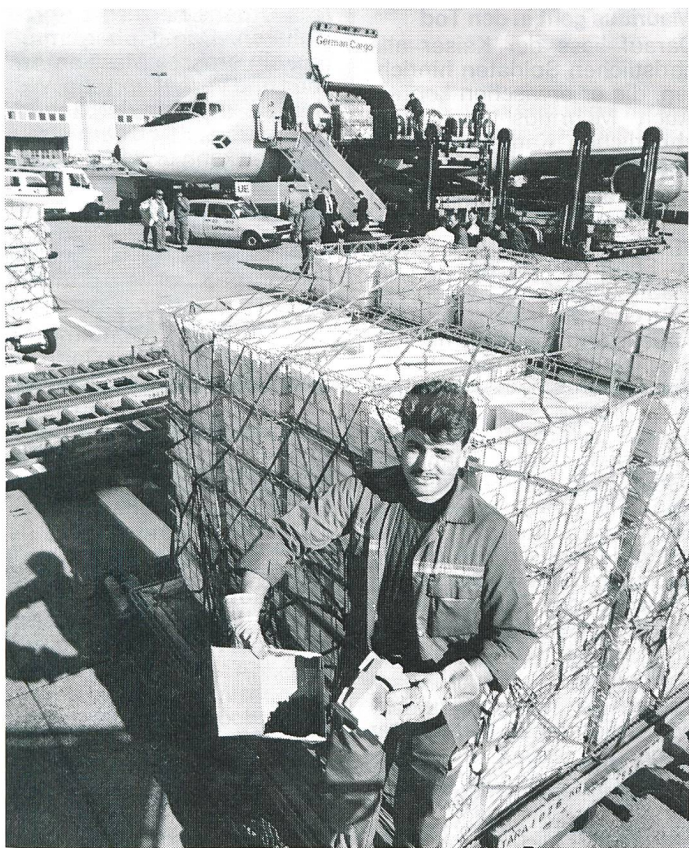
Die Fliegenlarven reisen in Pappkartons: 1600 Fliegen pro Karton, 24 Kartons pro Korb, 76 Körbe pro Palette = 2,9 Millionen Fliegen pro Palette.

40 Millionen Fliegen gehen auf grosse Reise – über den Atlantik von Tuxtla Gutierrez (Mexiko) ins libysche Tripolis. Aber sie fliegen nicht etwa mit eigener Flügelkraft, sondern düsen komfortabel mit dem Flugzeug. German Cargo Services (GCS), die Fracht-Charter-Tochter der Deutschen Lufthansa, bekam diesen ungewöhnlichen Transportauftrag von der Ernährungs- und Landwirtschaftsorganisation der Vereinten Nationen (FAO). Zweck der Fliegenwanderung ist der grossangelegte biologische Kampf gegen einen der gefährlichsten Schädlinge in Nordafrika. Dort bedrohen Larven der Schraubenwurmfiegen den gesamten Tierbestand und können auch für Menschen lebensgefährlich werden. Die FAO will sechs Monate lang wöchentlich einen Flug mit diesem «Fliegengewicht» von etwa 11,4 Tonnen starten. Danach sind für weitere zwölf Monate sogar jeweils zwei Fliegen-Flüge pro Woche geplant.