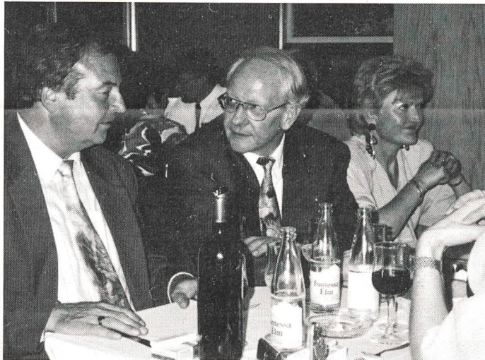
Der scheidende Präsident und seine Frau beim Nachtessen. Sie werden sich die Zukunft sicher öfter sehen als bis jetzt.