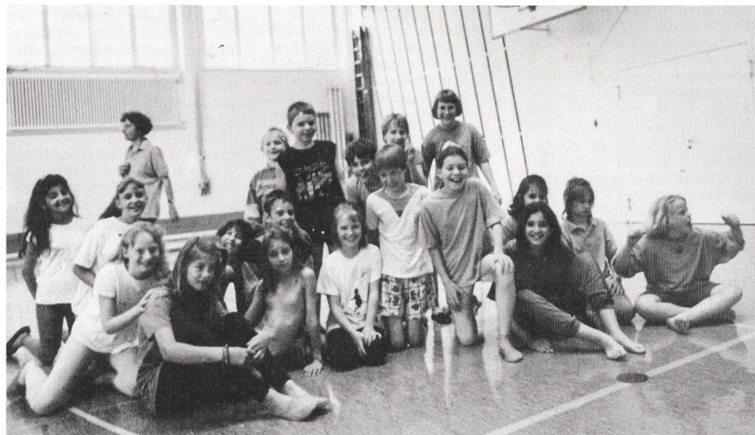
Das Spiel ging unentschieden aus. Die gehörlosen und hörenden Turner stellen sich strahlend dem Fotografen.

Dass hörende Kinder mit gehörlosen zusammen spielen, ist positiv für beide. Hörende entwickeln so ein viel natürlicheres Verhältnis zu Behinderten. Und die Gehörlosen