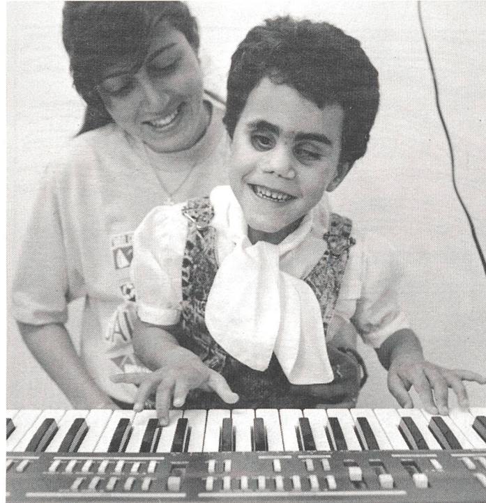
Das gehörlose und sehgeschwache Mädchen hat sichtlich Spass am Musizieren.

«Wir sind eigentlich eine private Institution», erklärt uns Direktorin Véronique Carthy, eine sympathische Irländerin im Ordenskleid. «Unser Orden ist schon fast 150 Jahre im Heiligen Land tätig. Zuerst waren unsere Gebäulichkeiten ein Waisenhaus, dann ein Dispensarium. 1964 bat uns der israelische Staat um Hilfe. Die Zahl der gehörlosen und blinden Kinder wuchs und wuchs. Aber niemand kümmerte sich um sie. Heute werden hier 106 Kinder unterrichtet, 66 gehörlose und 40 sehgeschwache. Elf unter ihnen leben auch hier, die andern gehen abends heim und kom-