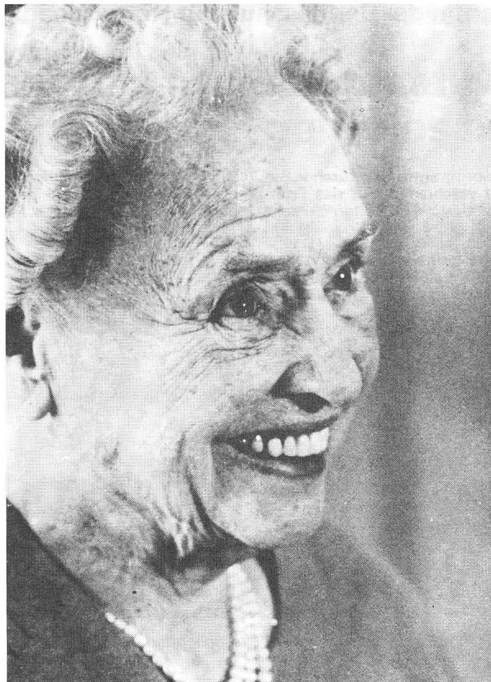
Helen Keller als 80jährige, 1960, mit strahlenden Augen!

Helen Keller liebte Reisen und war fast überall auf der Welt. Im Sommer 1893 besuchte sie in Begleitung von Dr. Bell die Weltausstellung in Chicago. Es war für sie wie ein lebendig gewordenes «1001 Nacht». Nachdem das Buch «Meine Welt» erschien, hat ein bekannter amerikanischer Schriftsteller, Mark Twain, sie eingeladen. Er erzählte ihr forlaufend Geschichten und unternahm mit ihr ausgedehnte Spaziergänge. Wegen ihrer Taubblindheit nahm sie Teacher