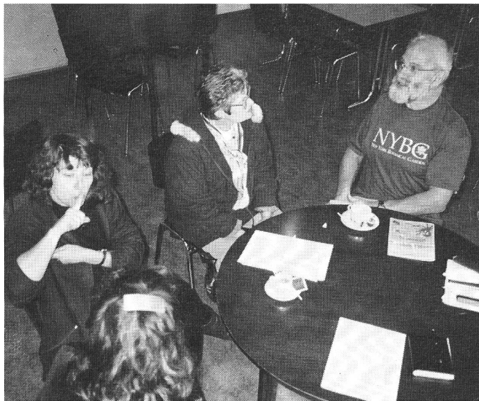
Gespräch am runden Tisch mit dem berühmten Autor.