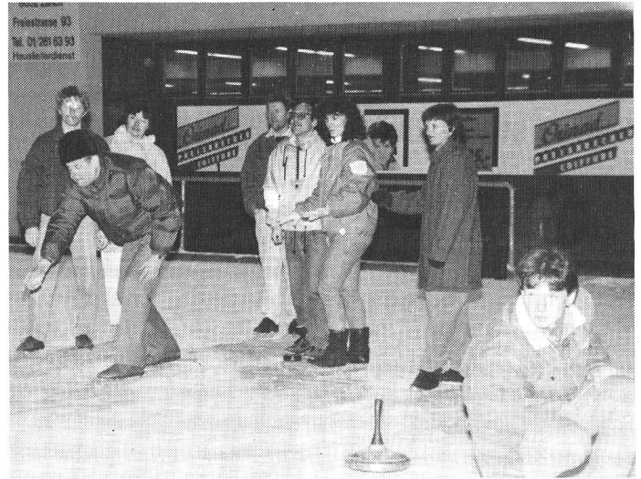
Gespannt schauen alle auf den Eisstockschiess des Spielers vorne links.

Isu/ Am 6. März 1993 hat die Schweizerische Vereinigung gehörloser Motorradfahrer SVGM zum ersten Mal eine besondere Veranstaltung auf der Kunsteisbahn Dolder in Zürich organisiert. Die Idee stammt von Martin Risch. Gegen Abend waren ca. 20 Leute anwesend.