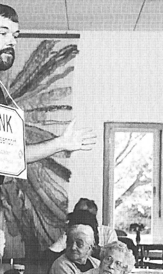
Marzia Brunner beginnt im Oktober mit dem Vorkurs für die Sozialpädagoginnen-Ausbildung.

W.G.: Ausgebildete Sozialpädagogen übernehmen die Funktion der Fürsprecher . Sie schauen vor dem Eintritt und während des Aufenthalts für