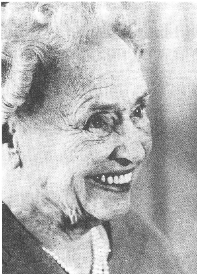
Helen Keller als 80jährige, 1960, mit strahlenden Augen!

Helen Keller liebte Reisen und war fast überall auf der Welt. Im Sommer 1893 besuchte sie in Begleitung von Dr. Bell die Weltausstellung in Chicago. Es war für sie wie ein lebendig gewordenes «1001 Nacht». Nachdem das Buch «Meine Welt» erschien, hat ein bekannter amerikanischer Schriftsteller, Mark Twain, sie eingeladen. Er erzählte ihr forlaufend Geschichten und unternahm mit ihr ausgedehnte Spaziergänge. Wegen ihrer Taubblindheit nahm sie Teacher