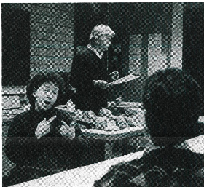
Immer häufiger stehen die Dolmetscherinnen des SVG im Einsatz. Die Gesuche steigen jährlich, obwohl noch längst nicht alle Gehörlose den Vermittlungsdienst kennen und benutzen.

Im Mai 1985 wurde mit der Vermittlung von Dolmetschern begonnen. Der SVG griff damit einen Antrag des damals noch existierenden Gehörlosenrates auf. Die Dolmetscher und Dolmetscherinnen der ersten Stunde leisteten Pionierarbeit und begannen mit den ersten offiziellen und bezahlten Dolmetschereinsätzen, noch ehe es eine Dolmetscherausbildung gab. Ihre Dolmetscherfähigkeiten hatten sie im täglichen Umgang mit Gehörlosen gelernt. Zum Beispiel als Lehrer/-innen und Erzieher/-innen an Gehörlosenschulen,