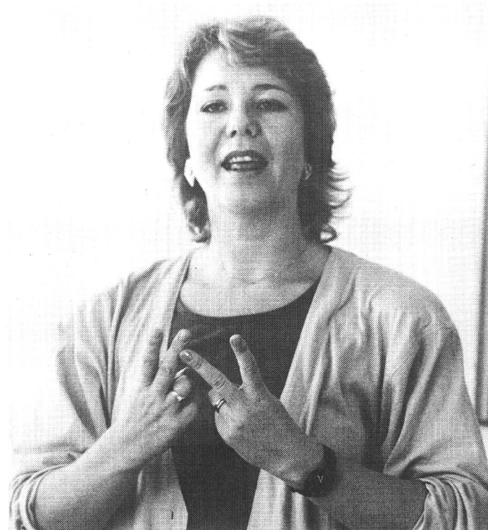
Dolmetscher/-innen lernen in der Ausbildung von Gebärdensprache zu Lautsprache und von Lautsprache zu Gebärdensprache zu übersetzen.

Wie bis anhin sollen auch in Zukunft verschiedene Dol-