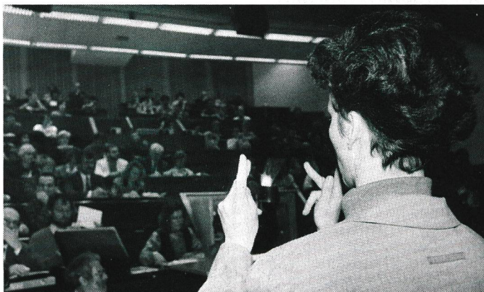
Die Dolmetschervermittlung hat 1992 doppelt so viele Einsätze vermittelt wie im Vorjahr.