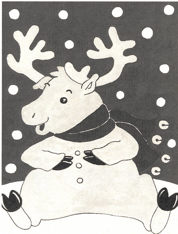
Maskottchen der 13. Winterspiele der Gehörlosen in Ylläs (Finnland) vom 10. – 20. März 1995.