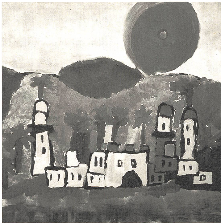
Eines der ausgestellten Bilder, die in Riehen gezeigt werden.

Herr Hadorn, die Gehörlosen-Zeitung dankt Ihnen für das Interview und wünscht Ihnen privat und beruflich alles Gute.