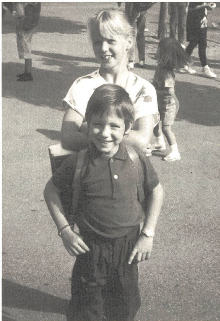
«Hörgeschädigte Mädchen und Jungen, die eine Regelschule besuchen, haben unterschiedliche Voraussetzungen.»