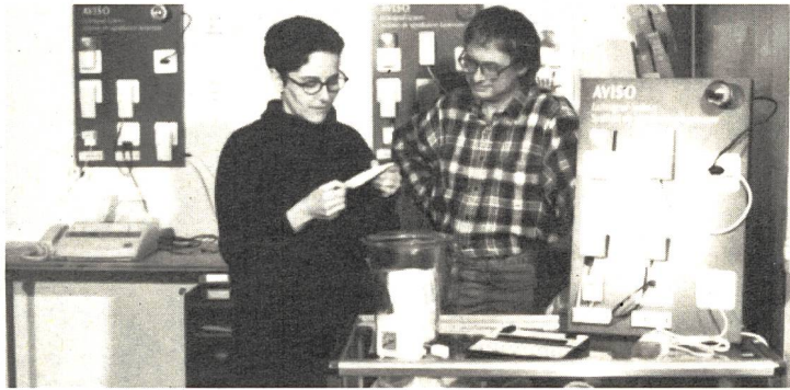
Der spannendste Moment! Sekunden später ist die Hauptgewinnerin bekannt.

Seit 15 Jahren entwickelt und produziert die Genossenschaft Hörgeschädigten-Elektronik in Wald elektronische Hilfsmittel für Hörgeschädigte. Das Jubiläumsjahr 94 war Anlass für diverse Aktionen, so zum Beispiel für einen Tag der offenen Tür. Zum Jahresende konnten Kundinnen und Kunden an einem Wettbewerb teilnehmen, der im Brief aus Wald