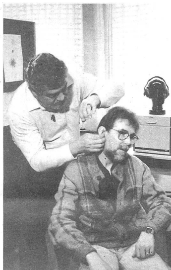
Pro Jahr werden 30 000 Hörgeräte verkauft.

Wie der «Tagi» zu berichten weiss, leben in der Schweiz rund 600 000 Hörbehinderte. Davon ist jedoch nur ein Sechstel mit einem Hörgerät versorgt. Pro Jahr werden 30 000 Geräte verkauft. Marktführer (25 %) ist die Stäfermer Phonak, gefolgt vom dänischen Hersteller Widex (15 %), Otikon, Starkey, Ascom-Tochter Audiosys, Siemens-Reston und Philips. Insgesamt sind 18 Hersteller auf dem Schweizer Markt tätig.