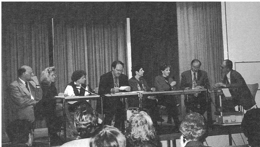
Fachleute bei der Diskussion über unterschiedliche Haltungen zum CI.

Gehörlose Kinder kann man nach verschiedenen Menschenbildern anschauen. Als geschädigter Mensch im Vergleich zur Restgesellschaft, d.h., auf die Fürsorge der Allgemeinheit angewiesen. Da-