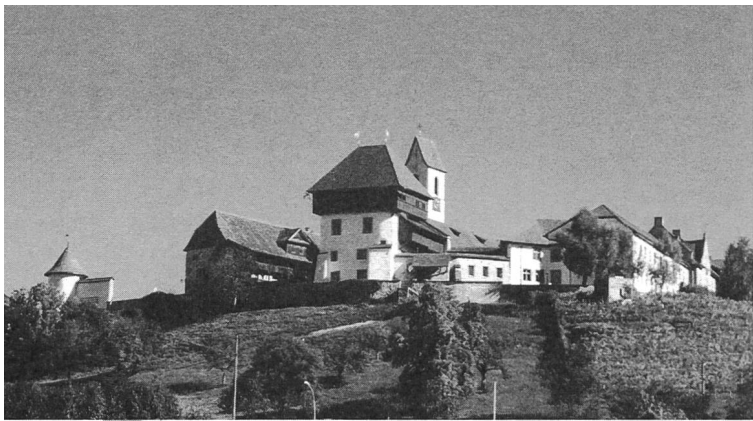
Kantonale Sonderschulen Hohenrain

Luzern, führte u.a. zum Thema «Medizinische Aspekte des Cochlea Implants» aus, wie wichtig eine gute Teamarbeit zwischen den einzelnen Disziplinen ist. Im weiteren gab er detaillierten Einblick in die Anatomie des Ohrs, die Operationsvoraussetzungen beim CI-Empfänger, den eigentlichen Operationsvorgang und mögliche Gründe, die zu einer Hörschädigung führen können. Zu letzteren gehören: