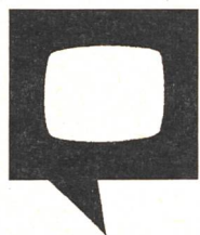
Zeichen für Untertitelte Videokassetten

Diesen Sommer durfte Procom ein weiteres kleines Jubiläum feiern, die 500 000. Telefonvermittlung! Was 1985 klein und bescheiden seinen Anfang nahm, ist heute eine Organisation für die ganze Schweiz, für alle Landessprachen und noch einige Fremdsprachen dazu. Procom führt eine Neuerung ein: Seit 1. November 1996 geben die VermittlerInnen nicht mehr ihren Namen an, sondern eine persönliche Kennzahl. 01 bis 99 = persönliche Nummer der Vermittlungsperson. Erscheint ein F, so vermittelt eine Frau, bei M ein Mann. Über die Sprachkenntnisse geben die folgenden Buchstaben nach der Nummer Aufschluss: D = deutsch, I = italienisch, F = französisch, S = spanisch, E = englisch. Beispiel: M06/D/F/E = Mann/persönliche Nummer 06/vermittelt in Deutsch/Französisch/Englisch.