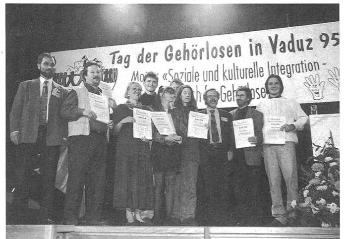
Tag der Gehörlosen in Vaduz: Forderung nach sozialer und kultureller Integration

Ein Benachteiligungsverbot allein genügt nicht. Erst ein Gleichstellungsgebot gibt dem Gesetzgeber auf Bundes- und kantonaler Ebene die Möglichkeit zu gezielten Vorgaben. Besonderer Handlungsbedarf besteht in Schule, Ausbildung sowie bei Arbeit, Verkehr, Kommunikation und Wohnen.