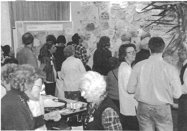
Bei der Zukunftswerkstatt in Boldern konnte man seinen Ideen freien Lauf lassen

Daran nahmen ältere Gehörlose, gehörlose sowie hörende Fachleute in der Altersarbeit und VertreterInnen der Institutionen im Kanton Zürich teil. Der Begriff «Zukunftswerkstatt» bezeichnet eine Methode, die aus drei verschiedenen Phasen besteht: In der Kritikphase wird die Zufriedenheit oder Unzufriedenheit mit der bestehenden Situation formuliert. In der folgenden Phantasiephase kommen Wünsche oder Träume für die Zukunft zum Ausdruck. Und in der abschliessenden Verwirklichungsphase wird überlegt, wie man diese Wünsche konkret in die Realität umsetzen könnte. Dabei sollen verschiedene Ideen und Bedürfnisse einfließen und zu einer gemeinsamen Lösung finden.