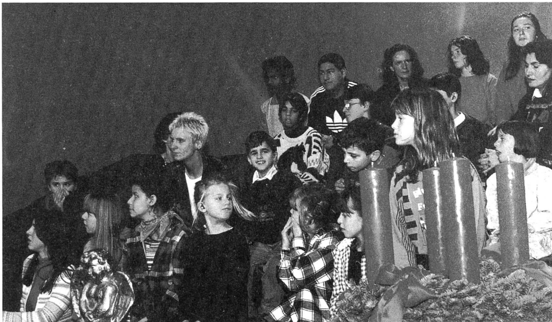
Die Schüler der Kantonalen Gehörlosenschule Zürich waren bei der Sendung «Sehen statt hören» und erhielten Einblick in die Fernsehwelt.