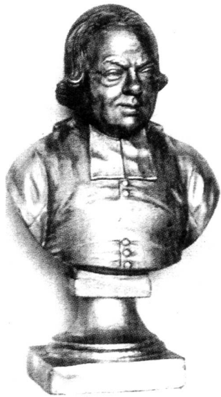
Dr. Johann Friedrich Stork, 1. Direktor des k.k. Taubstummen-Instituts (1779–1792)

Im Schuljahr 1980/81 wurde im Institut eine Klasse für taubblinde Kinder eröffnet. Die Expositur* der «Höheren Bundeslehranstalt für Mode und Bekleidungstechnik» (ehemalige Bundesfachschule) wurde im Schuljahr 1988/89 durch einen 2-jährigen Aufbaulehrgang erweitert. Abgänger der Expositur können nach der Abschlussprüfung seither im Anschluss diesen Lehrgang besuchen und die Matura ablegen. Die erste Matura wurde im Juni 1990 abgenommen.