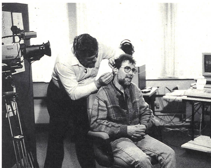
Beim Hörgeräteakustiker wird ein Hörgerät angepasst.