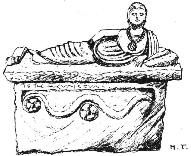
GRAB - ETRUSKERIN MIT HALSKETTE

Der dritte Diener, klein von Gestalt, mit einem pffiffigen Gesicht und hellem Geist, nahm sich Zeit. Er ritt ans Meer und schiffte sich ein. In fernen Ländern lernte er bei Goldschmiedemeistern deren Handwerk. Er fand Goldklümpchen und nahm sie mit nach Hause. In seiner Hütte, inmitten der Feigenbäume, sass er Tag und Nacht an der Werkbank. Aus Goldklümpchen wurden Stäbchen; aus Stäbchen Scheibchen ... Vor Müdigkeit fielen ihm die Augen zu. Als er erwachte, sah er vor sich allerfeinste Goldkugeln; sie fun-