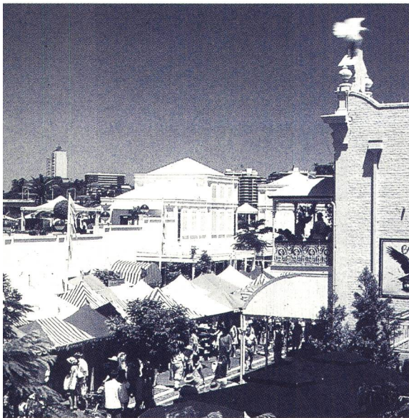
Gemütliche Restaurants und Cafés unterbrechen mit viel Farbe die Gebäulichkeiten der Stadt

In der Nähe des Flusses befindet sich der Botanische Garten, durch den ein schöner Fussweg führt. Selbstverständlich stehen auch Fähren zur Überquerung des Flusses zur Verfügung. Seine beiden Seiten gehören zum wichtigsten Erholungsgebiet der Stadt. Es fehlt nicht an Parks und Cafés für jene, die sich in Ruhe setzen und die Landschaft geniessen wollen. Unser Klima ist so angenehm und gastfreundlich, dass man nur auszugehen braucht, um zu geniessen. Wirklich ein Ort, wo sich gut leben lässt. Das nächste Mal werde ich Sie mit einigen Sehenswürdigkeiten bekannt machen. Entschuldigung, es hat zu regnen aufgehört, und mein Hund Poppy wartet ungeduldig auf seinen Spaziergang.