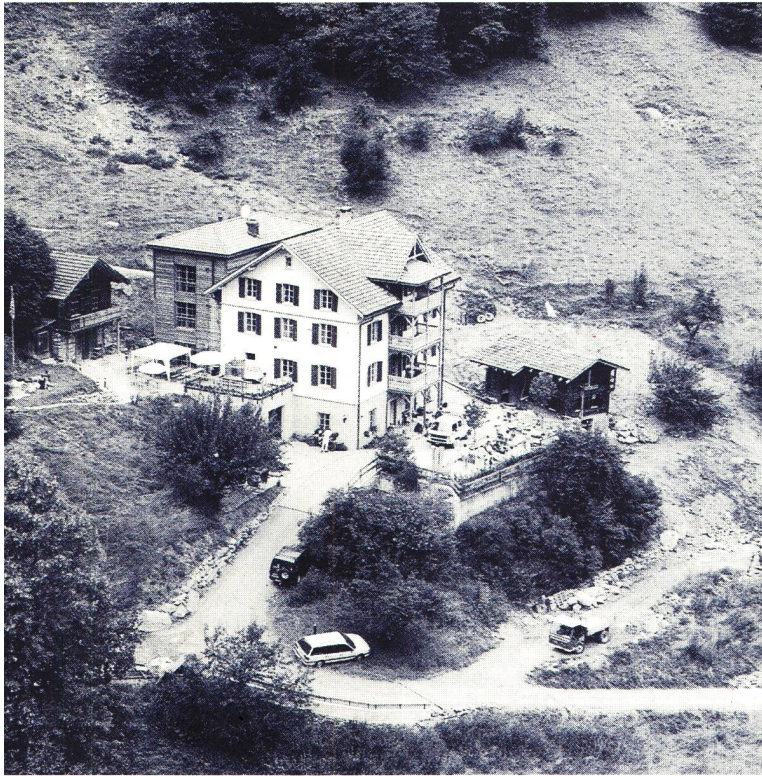
Das Hauptgebäude der Genossenschaft Fontana Passugg liegt auf 800 m ü. M. in der Gemeinde Malix. Dazu gehört ein Gelände von rund 26 000 m 2 mit Wiesen und Wald und den 4 Nebengebäuden.

Schwerhörigen und Spätertaubten, mit Unterstützung von Hörenden (die offizielle Eröffnung fand im April 1997 statt)