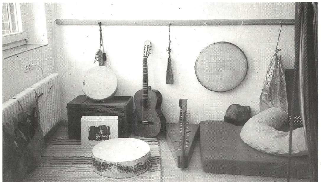
Blick auf die «Musik-Ecke» in einem Schulzimmer. Schlag-, Rhythmik- und Saiteninstrumente machen Töne durch ihre Schwingungen fühlbar.

Bei der Planung und dem Bau der Heimanlage in Langnau wurde das Erlernte aus dem Umgang mit taubblinden Menschen umgesetzt. Ziel ist es, den Hör-/Sehgeschädigten vielfältige Erfahrungs- und Betätigungsmöglichkeiten anzubieten, damit sie grösstmögliche Selbständigkeit erlangen. Die verschiedenen Angebote im Heiminnern sowie in der Aussenanlage sollen im Behinderten Neugierde und Interesse