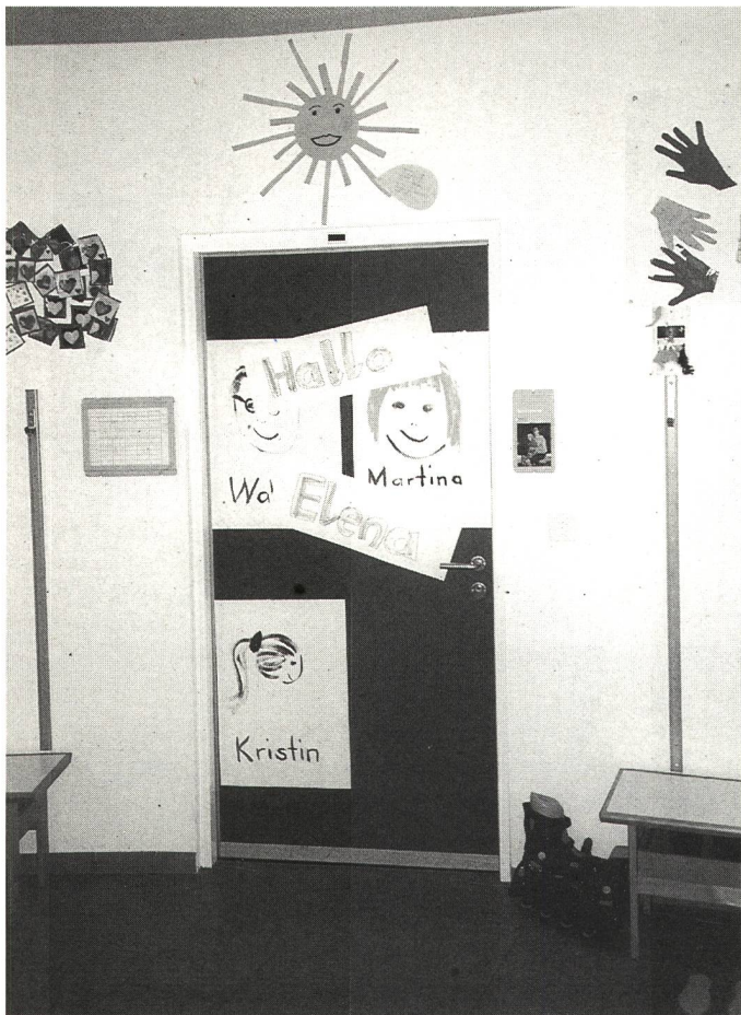
Eine fröhlich gestaltete Schulzimmertüre. Jedes Kind wird mit einem individuell abgestimmten Stundenplan gefördert.

nissen ernst genommen und individuell in ihren Fähigkeiten gefördert werden - wenn nötig ein ganzes Leben lang.