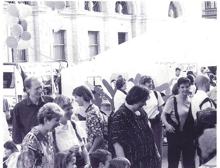
Viel Betrieb um das Zelt der Gehörlosen am «Züri-Fäscht», Anfang Juli 1998

Es war ein Vergnügen, dem Festtreiben zuzusehen. Es bestanden keine Grenzen, alle mischten sich zusammen,