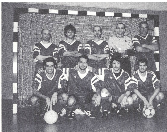
Der Sieg geht an den SS-Ticino - Bravissimo!

Vorletztes Jahr wurde der SS-Ticino bei der Freiluft-Disziplin in St. Gallen Schweizer Meister und landete 1998 wieder auf dem 1. Rang. Lauter Siege brachten dem SS-Ticino zum zweiten Mal nacheinander den Wanderpreis. Die Mannschaft hatte gute Leistungen erbracht. Einen schwarzen Tag erlebte der GSV-Basel, welcher mit nur einem Punkt auf