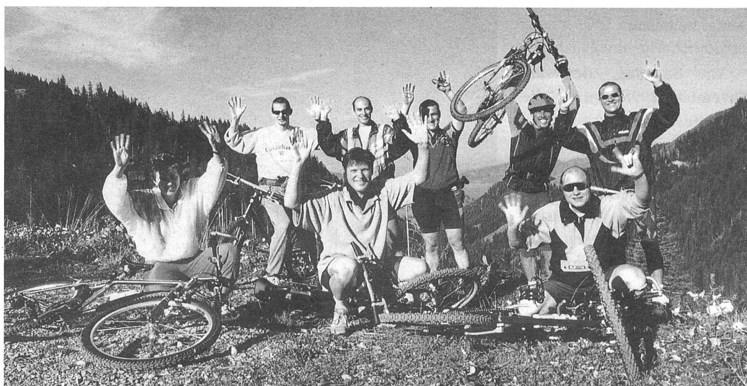
Glücklich den Berg erklommen dank 4 Stunden Ausdauer und Muskelkraft in den Beinen.