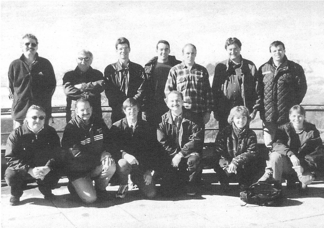
Die Teilnehmerinnen und Teilnehmer der letzten OK-Sitzung machten einen Ausflug aufs Jakobshorn, auf 2500 Meter über Meer.