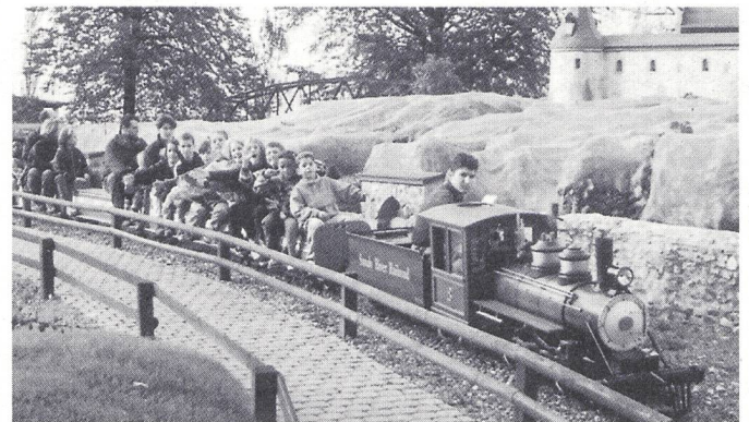
Eine Dampfloki fährt am Schloss Aigle und an Reben vorbei.

Für den Hunger war ein typisches Walliser Gericht serviert worden: Raclette! Die Walliser Männer schmolzen den Käse am Racletteofen sehr gekonnt und die Walliserinnen verteilten ihn an die Gäste. Ehrensamt war, dass auch der Direktor des Verkehrsbüros und der Sekretär der Gemeinde kurz anwesend waren.