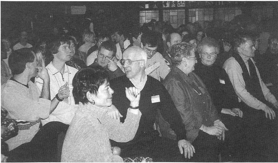
Ein voller Saal im Restaurant Bürgerhaus in Bern. 220 Personen waren gekommen, um über die Stellung der Gebärdensprache zu diskutieren.

sta/Die Gehörlosenkonferenz vom 21. November 1998 in Bern, an der 120 Gehörlose und 100 Hörende teilnahmen, stand ganz im Zeichen der Gebärdensprache. Heutzutage ist wissenschaftlich erwiesen, dass es sich dabei um ein vollwertiges, eigenständiges Sprachsystem handelt. Daher setzen sich die gebärdenden Gehörlosen des Schweizerischen Gehörlosenbundes SGB/FSS für eine Anerkennung der Gebärdensprache in der Schweiz auf politischer Ebene - mit allen rechtlichen Folgen - ein. Dass es ihnen letztlich um ihre spezielle Kultur, ja um ihre eigene Identität geht, zeigte das Motto in Bern: «Gehörlose ohne Gebärdensprache - Bäume ohne Wurzeln!»