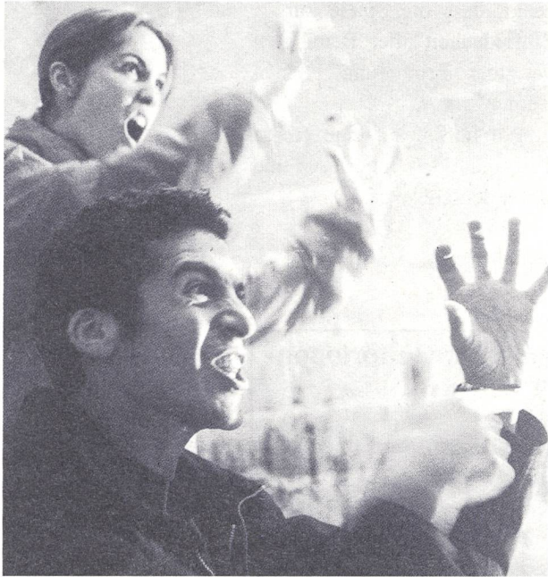
Gehörlose SchauspielerInnen des «International Visual Theatre Paris»

sta/Das bekannte «International Visual Theatre» aus Paris kommt nach Zürich! Innerhalb des «Kulturinsel-festes» vom 19., 20. und 21. März 1999 werden die gehörlosen SchauspielerInnen im Theaterhaus Gessnerallee ihre Produktion «Des chateaux en Bretagne» (Schlösser in der Bretagne) vorführen. Zuvor erhält die «Theaterwerkstatt Schweiz» - eine Gruppe von hörenden und gehörlosen Theaterschaffenden - am 18. März 1999 Gelegenheit, ihre Arbeit vorzustellen.