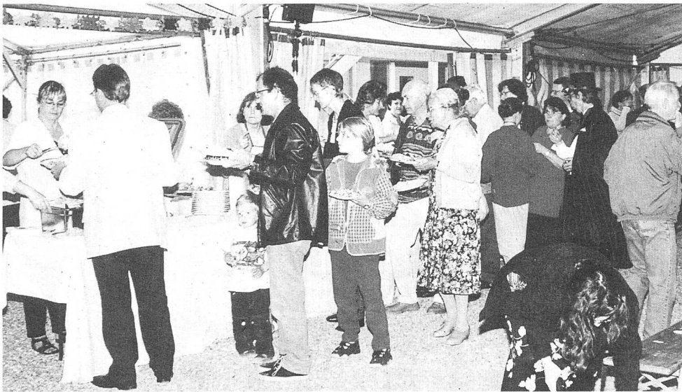
Die Gäste standen in einer Riesenschlange zum Essen an. Das Zelt war voll.

vorlieb, da das Wetter zwar bedeckt, doch recht kühl war. Gehörlose sorgten mit lebhafter und Hörende mit lauter Diskussion für gute Stimmung sowohl im Zelt als auch im und ums Haus herum.