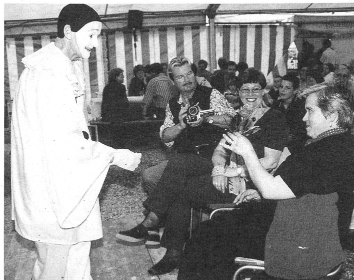
Pierrot war verliebt in Elise!

Auch hier war wieder eine grosse Besucherschar zu verzeichnen. Obwohl es regnete! Wie bereits erwähnt, hätte dann eigentlich die Baumpflanzung stattfinden sollen. Stattdessen heiterte anschliessend die 10-jährige Kinderzirkusgruppe «Romani» aus Toffen das Publikum mit ihren Kunststücken auf. Den Rest des Tages verbrachte man wieder mit Rundgängen, Spielen usw. Gegen Schluss wurden die Gewinner des Fähnchenwettbewerbs bekannt gegeben, und danach schwebten die vielen bunten Ballone gen Himmel.