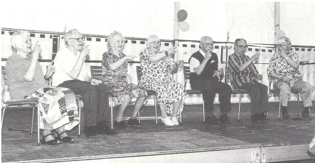
Sieben BewohnerInnen gebärdeten ihre Freudesbotschaft über den Einzug ins neue Heim.

yh/Der Höhepunkt dieses Festes wäre die Einpflanzung des Baumes gewesen, als Symbol für die HeimbewohnerInnen: Wurzel (Daheim), Stamm und Rinde (Mensch und Geborgenheit), Laub (Leben und Wohlergehen). Leider fiel dieser Akt der Bepflanzung buchstäblich ins Wasser. Am Sonntag regnete es, und der schön präparierte Rasenboden am Begegnungsplatz, wo der Baum stehen sollte, war völlig aufgeweicht und nass. Kurzfristig wurde deshalb (unfreiwillig) beschlossen, diese Zeremonie später im kleineren Kreis nachzuholen.