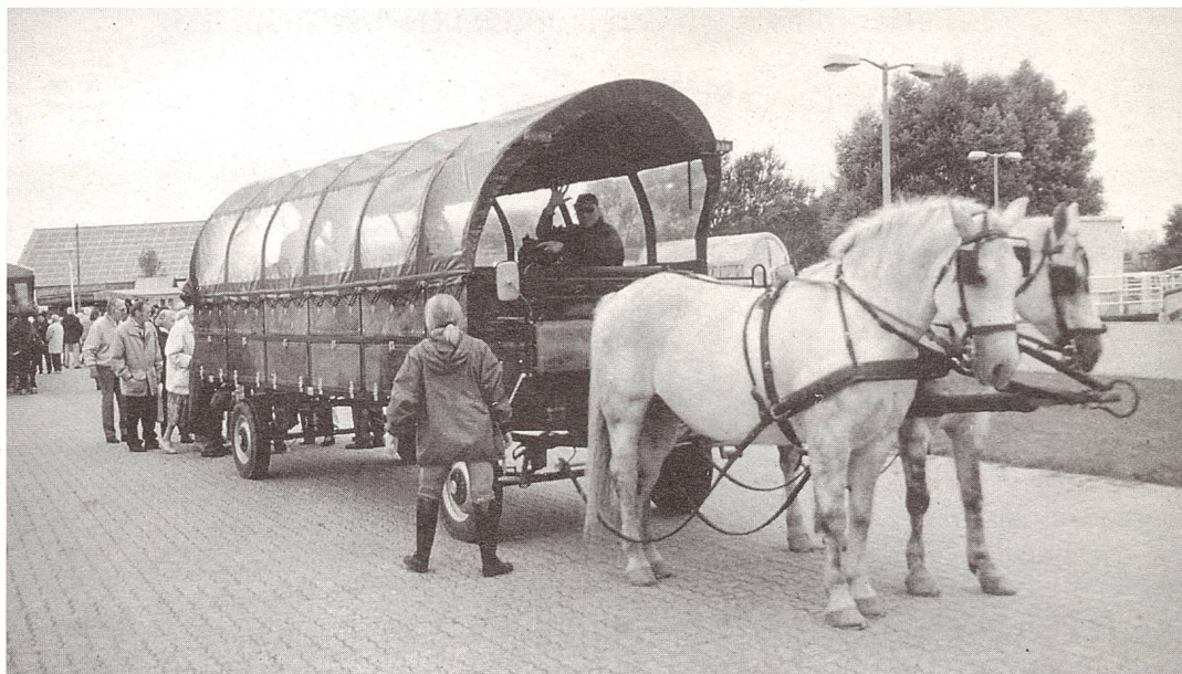
Kutschenfahrt auf der Ostseeinsel Hiddensee. Eine fast unberührte, abwechslungsreiche Natur prägt das Gesicht der Insel.

Corin, welches zwischen 1273 und 1334 errichtet worden war.