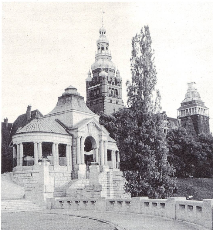
Stadtbefichtigung in Stettin, Polen

Über ein Kanalsystem ist die Havel nach Osten mit dem Havel-Oder-Kanal verbunden. In Oderberg unternahmen wir einen Ausflug zum Kloster