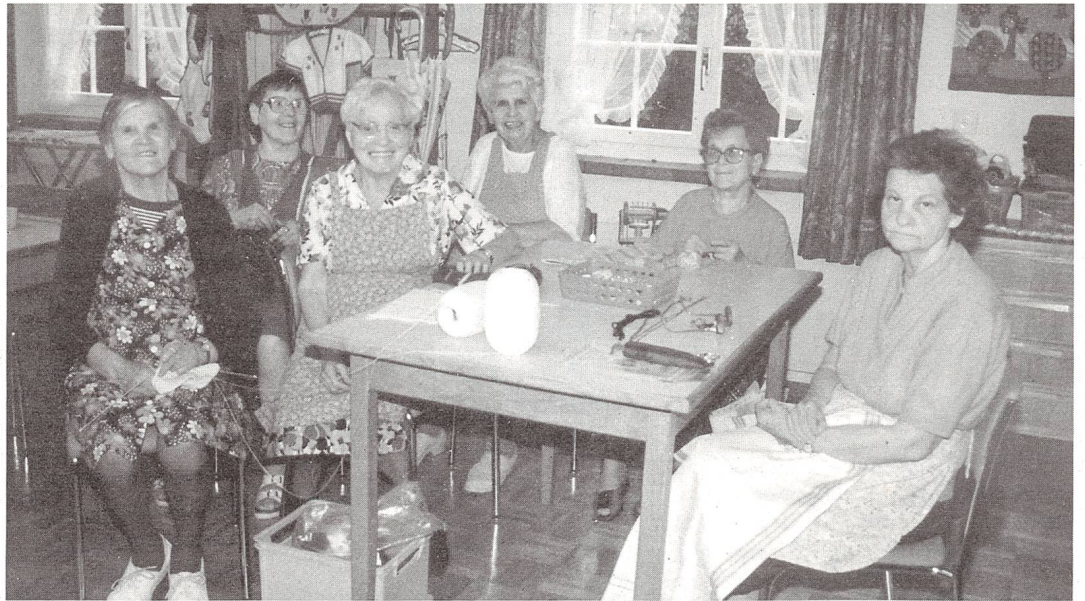
Gegenwärtig haben hier 23 Frauen und 11 Männer ein glückliches Zuhause.

bewährt. Es gab Pensionäre, die geradezu eine Arbeitswut entwickelten und sich schon morgens um 6 Uhr ans Werk machten, derweil die Arbeit immer auf Freiwilligkeit beruhte. So kam Hektik in den Tagesablauf, und das ist für ein Heim nicht gut.