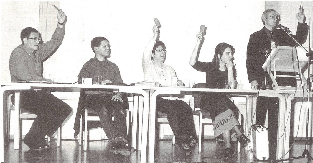
Rund 60 Personen nahmen an der 6. GV des LKH Schweiz im Centrum 66, Zürich teil.

sta/Seit 1994 vertritt der Verein LKH die Anliegen der lautsprachlich kommunizierenden Hörgeschädigten in der Schweiz. An der 6. Generalversammlung vom 14. April in Zürich gab es neben den üblichen Geschäften und Informationen zu geplanten Aktivitäten auch personelle Wechsel. Wer steht hinter dem Verein? Wir baten die Vorstandsmitglieder um ein Kurzporträt und unterhiel-