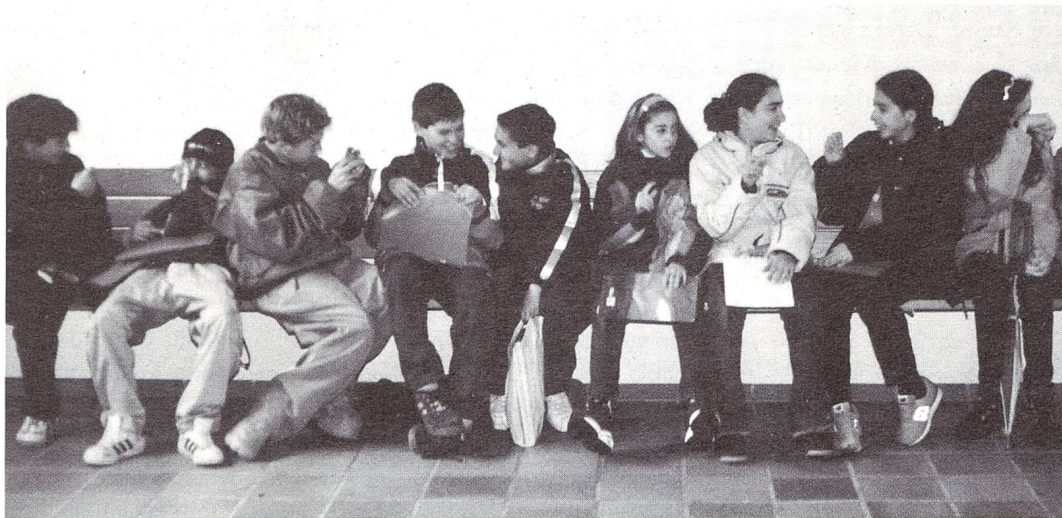
Kinder der 5. Regelschulklasse üben sich in der Gebärdensprache.