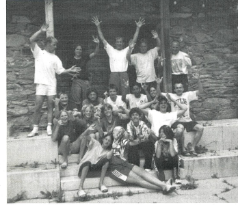
TeilnehmerInnen der 2. Woche