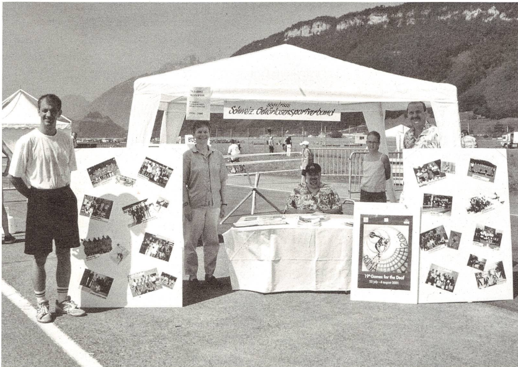
Der SGSV Stand präsentierte sich mit vielen Informationen und Geschichten