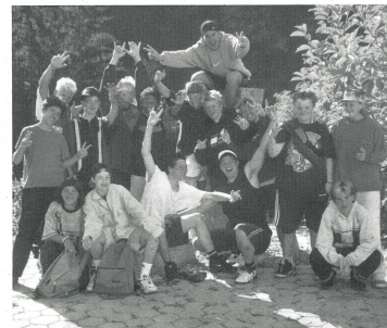
TeilnehmerInnen der ersten Woche