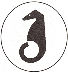
Das japanische Schriftzeichen für «gehörlos» gleicht einem Seepferd. Es ist auch das Symbol der japanischen Gehörlosengemeinschaft.

Engagiert in der japanischen Gehörlosenselbsthilfe, hält sie Vorträge über die Gehörlosensbewegungen in fremden Ländern, die sie bereist hatte (zum Beispiel Südostasien, Australien, Europa, USA). Nebst dem Reisen gehören Wellenreiten und Skifahren zu ihren Hobbys. Als persönliches Ziel bezeichnet sie die Weiterbildung. Ausserdem möchte sie einige Jahre in Europa leben und arbeiten. Wer weiss, vielleicht werden wir die unternehmungslustige Japanerin bald wieder in der Schweiz antreffen.