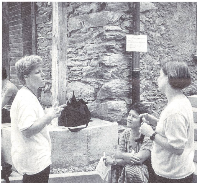
In Passugg sind alle willkommen! Gehörlose, Schwerhörige, Spätertaubte, Hörende suchen das Gespräch miteinander.